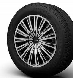
Wheel Design „Premium“