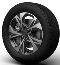
Wheel Design „Elite“