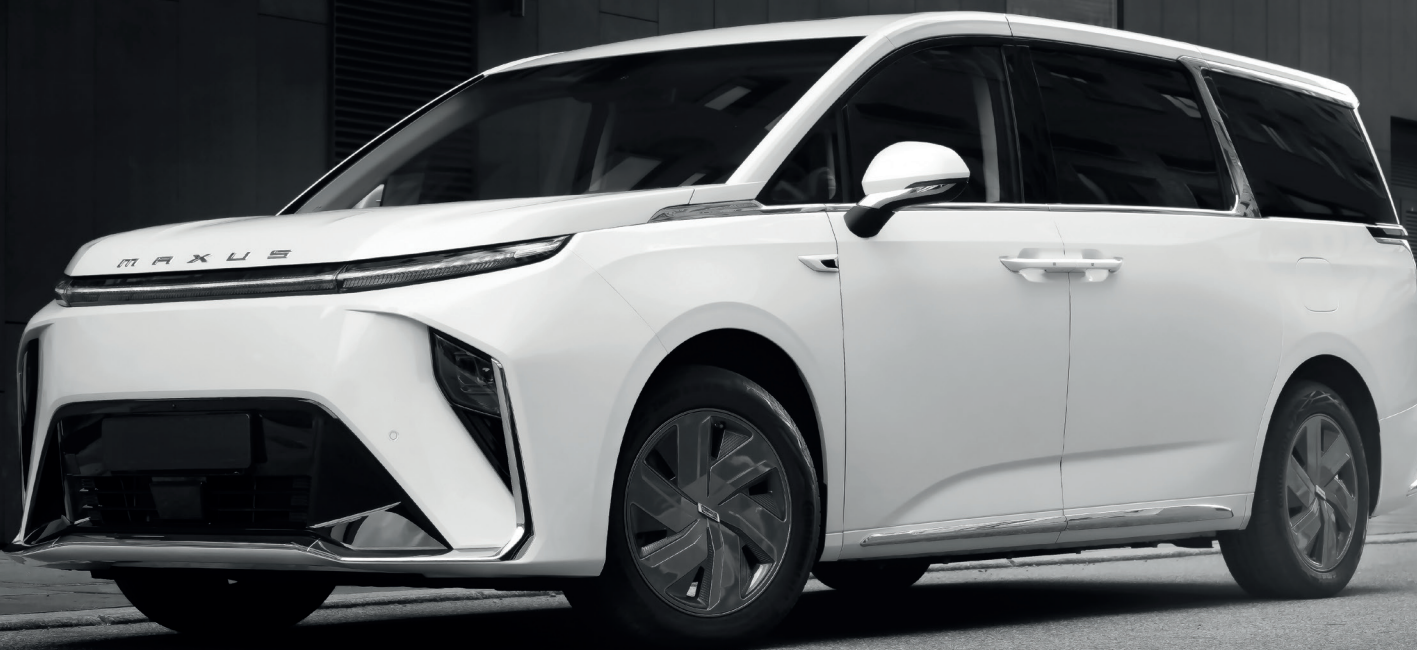
Immagine simbolica: il design e le caratteristiche del prodotto possono differire dal prodotto in vendita. Per maggiori informazioni, consultare questa brochure.