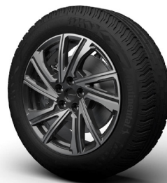
Wheel Design „Luxury“